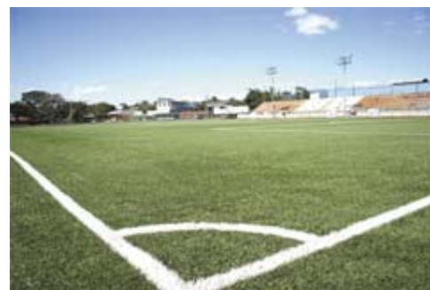
El Comité de Deportes de Belén invirtió ¢140 millones en la cancha del Polideportivo que será inaugurada en el mes de marzo. También tendrá una pista sintética de 6 carriles.

Saprissa renta su cancha, como mínimo, 6 veces a la semana, lo que le genera una ganancia que ronda los 6 millones de colones al mes. El Santos de Guápiles, que estrenó gramilla en junio de 2009, alquila su estadio unas 4 veces por semana, lo que deja en sus arcas un promedio de 2 millones de colones mensuales.